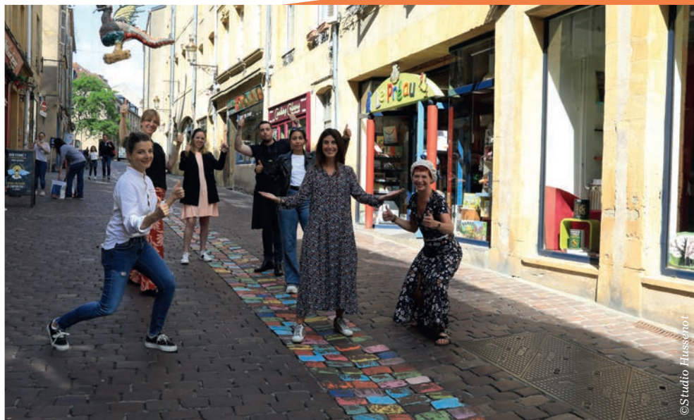
▲ Les commerçants de la rue Taison au centre-ville de Metz

Objectifs : renforcer l'attractivité commerciale ; favoriser la réhabilitation de l'habitat ; (re)mettre en valeur l'espace public et le patrimoine ; faciliter les projets à travers des dispositifs expérimentaux ; faciliter l'accessibilité et les mobilités ; rendre le cadre de vie plus attractif.