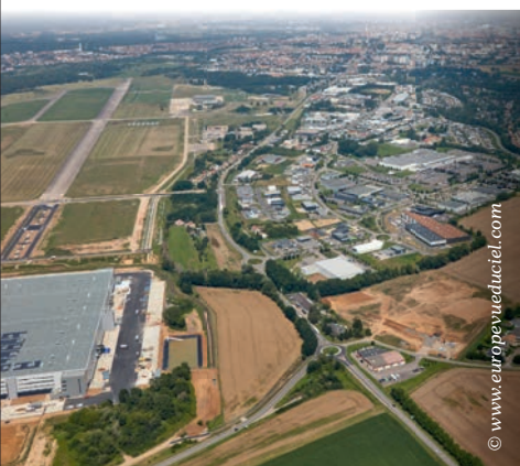
▲ Plateau de Frescaty, Marly Belle Fontaine et Marly Garennes.