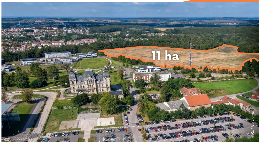
▲ Pôle Santé-Innovation de Mercy.

Standort des regionalen Klinikzentrums Centre Hospitalier Régional de Metz-Thionville, des Frau-Mutter-Kind-Zentrums und für verschiedene Wirtschaftsaktivitäten im Bereich Innovation im Gesundheitswesen mit 4100 Beschäftigten und renommierten Unternehmen. Das Zentrum für Innovation im Gesundheitswesen in Mercy bietet für Unternehmen und Startups weitere 11 Hektar.