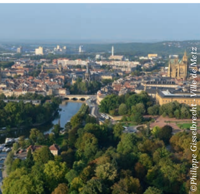
▲ Eurométropole de Metz.

10 GOOD REASONS TO INVEST IN METZ EUROMÉTROPOLE | 10 GUTE GRÜNDE IN DIE EUROMETROPOLE METZ ZU INVESTIEREN